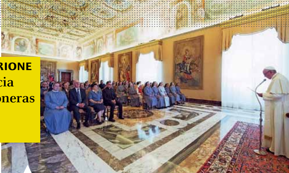
El Papa, en su discurso ante las pequeñas Hermanas Misioneras de la Caridad

F rancisco concedió el 26 de mayo una audiencia a las Pequeñas Hermanas Misioneras de la Caridad, el instituto fundado por san Luis Orione , que ha tenido su Capítulo General en mayo en Roma bajo el lema Donarse todas a Dios para darnos todas al prójimo: discípulas misioneras, testigos alegres de la caridad en las periferias del mundo . “En nombre de la Iglesia, de los tantos pobres, en modo especial mujeres y niños, y de los tantos enfermos físicos y psíquicos que asisten, les agradezco por su labor apostólica en las diversas actividades de pastoral juvenil, en las escuelas, en las casas para ancianos, en las catequesis y en los oratorios, con las nuevas pobrezas y en todos aquellos lugares en los cuales las ha puesto la Divina Providencia”, comentó.