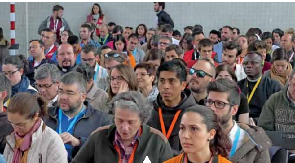
Un momento del Encuentro de Equipos de Pastoral Juvenil